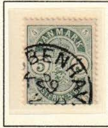
Pos. B 5