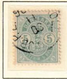
Pos. A 11