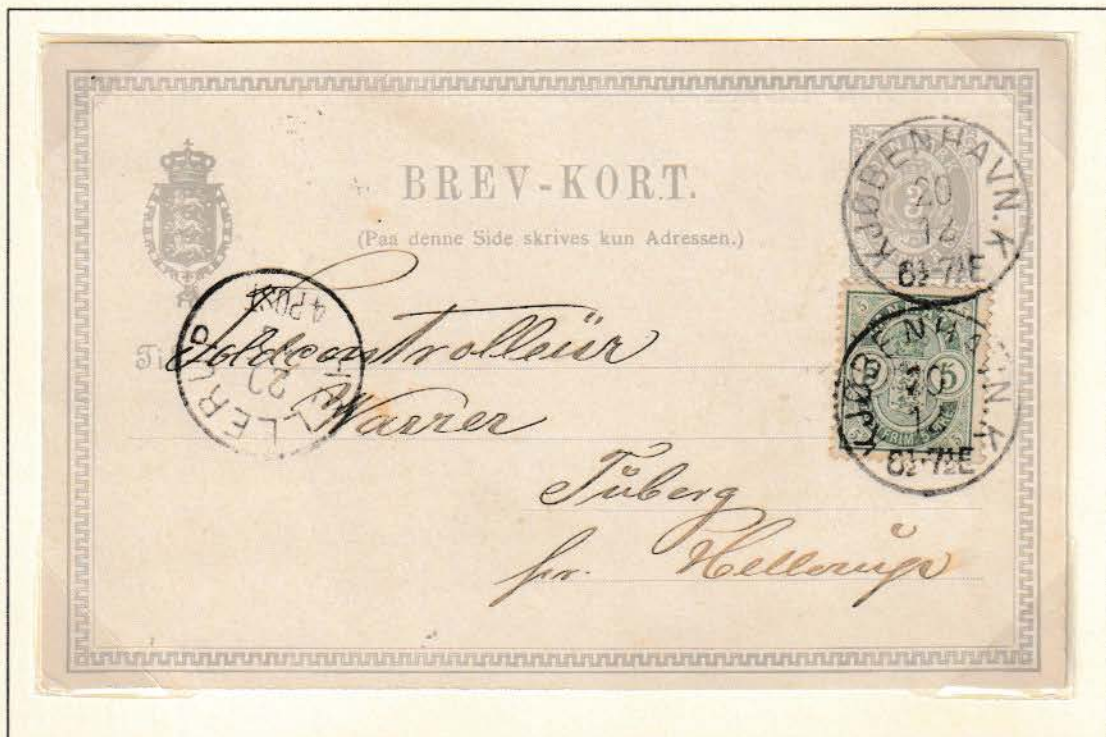
Opfrankeret brevkort sendt fra København 20.01.1892 fra København til Hellerup. Frankeret med 5 øre våbentype 13. tryk pos. A 12, overfranket med 3 øre. Gældende landspporto 01.04.1888 – 30.09.1902.