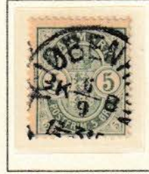
Pos. B 76