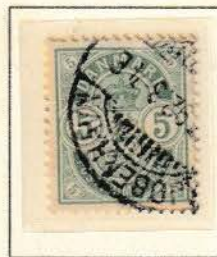
Pos. B 17