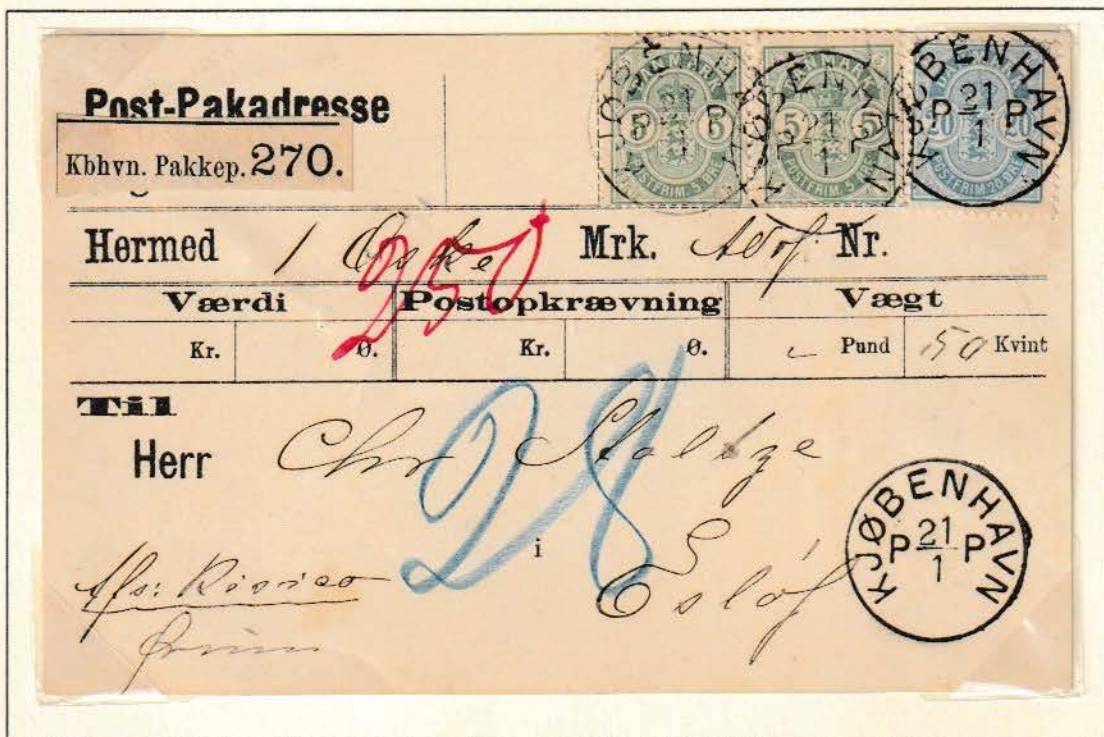
Adressekort - privatfremstillet - frankeret med parstykke 5 øre. Tryk 6 pos. A86 - 87 og 20 øre tryk 7, fra Kjøbenhavn 21.01.1888 til Esløf, Sverige for 1 æske på 50 kvint. Takst 0 - 3 pund: 30 øre. Nabolande takst gældende 01.10.1888 til 31.08.1917

2. serie – 5 øre grøn 1884 til 1892, tak 14 x 13 ½, Vm II