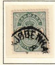
Pos. A 36