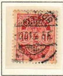
Pos. B 95