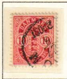
Pos. B 31