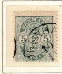
Pos. B 17