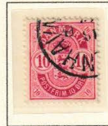
Pos. B 92