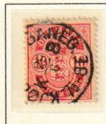
Pos. A 79