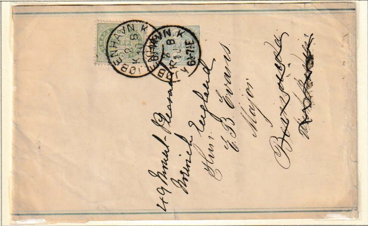
5 øre korsbånd opfrankeret med 5 øre våbentype 10. tryk matricetype 1, sendt til Bermuda og omfrankeret til England.. UPU porto gældende 1.4.1879 - 31.1.1921. Der kendes kun to 10 øres tryksagsforsendelser til Bermuda.

2. serie – 5 øre grøn 1884 til 1892, tak 14 x 13 ½, Vm II