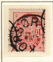
Pos. A 97 omv. vm

2. serie 10 øre rød 1885 - 1902, tak 14 x 13 ½, Vm II – Isolerede 1. serie klicheer