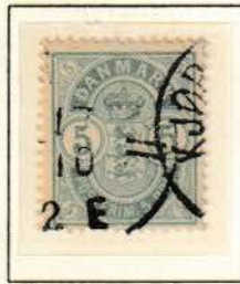
Pos. A 5