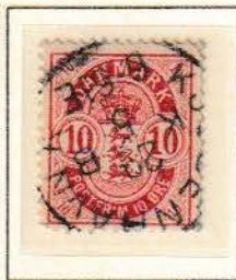
Pos. B 4