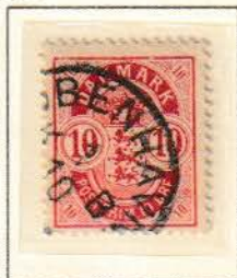
Pos. B 95