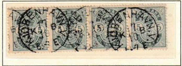
Pos. B 94 - 97