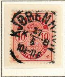
Pos. A 94