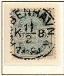
Pos. A 20