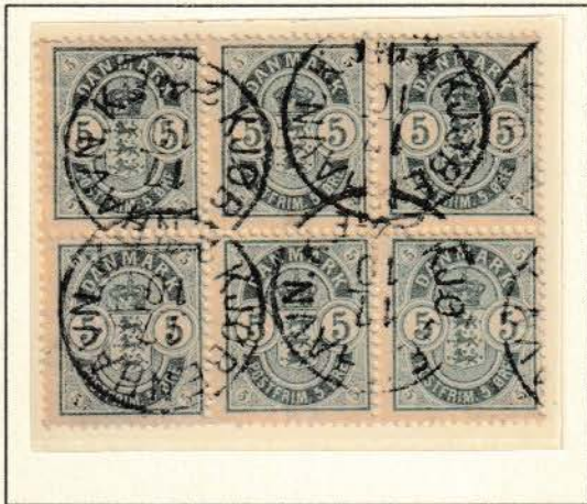
Pos. B 6 - 8/16 - 18