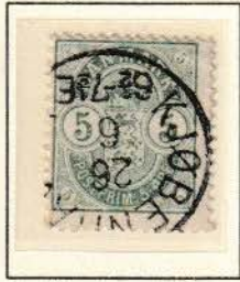
Pos. A 64