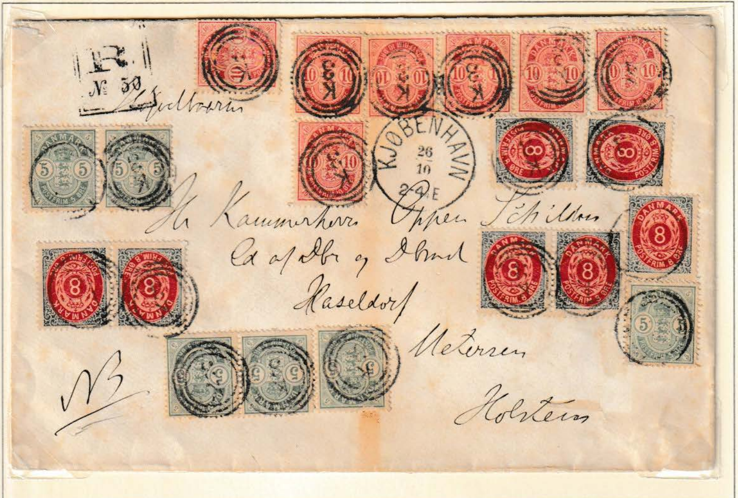
Rekommenderet brev vægtklasse 7 sendt fra København K 26.10.1889 til Tyskland. Frankeret med 7 stk. 8 øre tofarvet, 7 stk. 10 øre våbentype 7. tryk og 6 stk. 5 øre våbentype 9. tryk i alt 156 øre. Gældende UPU porto 01.07.1875 – 30.09.1902. Eneste kendte rekommanderede brev af vægtklasse 7 sendt til Tyskland.