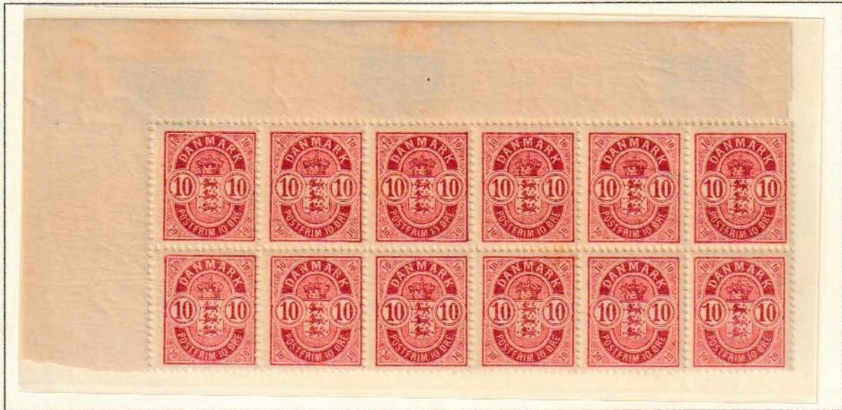
17. tryk pos. A1 – 6/11 - 16