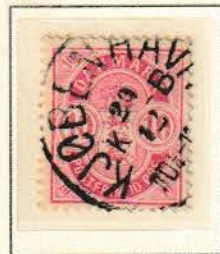
Pos. B 58