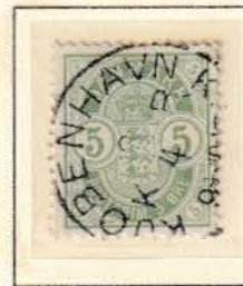
Pos. A 45