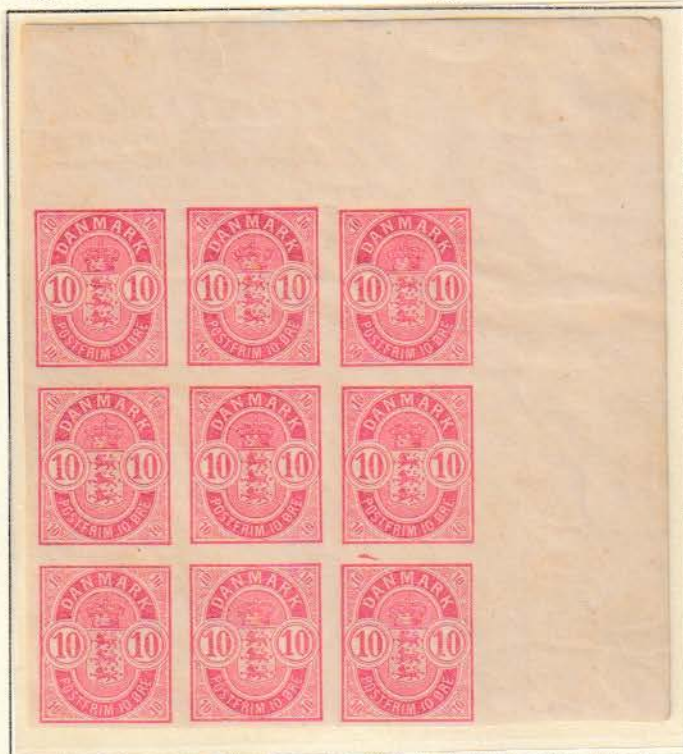
Pos. A 8 -10/28 - 30 Næststørste kendte enhed