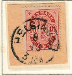
Pos. A 94

1. serien af 10 øre rød våbentype udkom udelukkende som brevkort, men ved en fejltagelse blev 3 klicheer, der ikke har været anvendt ved brevkortproduktionen i 2. serien. Disse findes i 6 tryk og er placeret som pos. 94, 96 og 97 i A-pladen