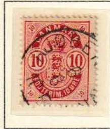
Pos. A 96