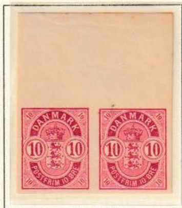
Pos. A 6 - 7

Utakkede 10 øre våbentype findes kun i 3. tryk og der kendes mærker fra 2 ark begge A ark.