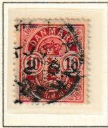
Pos. B 37