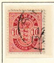
Pos. A 45