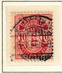
Pos. B 97