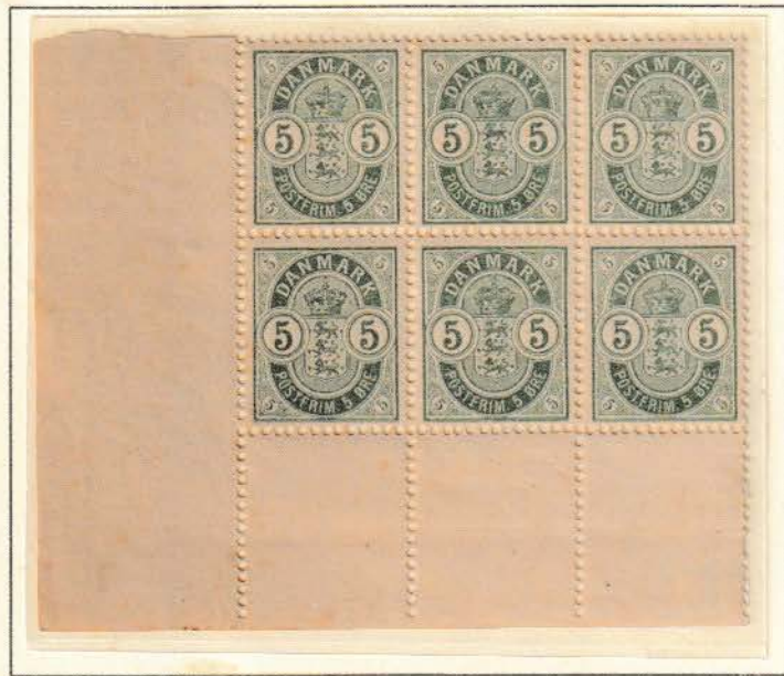
Pos. A 81 – 83/91 - 93