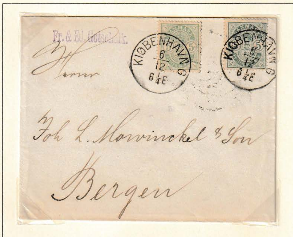
Brev frankeret med parstykke 2 stk. 5 øre. Tryk 7, matricetype 1N og tryk 8, matricetype 2 fra Kjøbenhavn 06.12.1888 til Bergen. UPU takst gældende 1.10.1888 til 31.8.1917