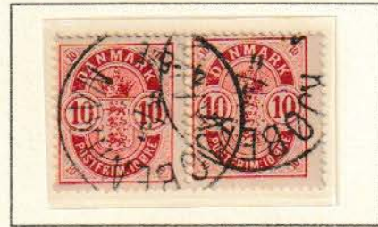
Pos. A 96 – 97