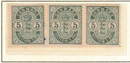
Pos. A 34 – 36