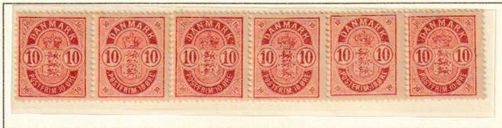
Pos. A 93 – 98

Den ene af 3 kendte striber indeholdende alle isolerede 1. serie klicheer.