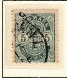
Pos. A 96