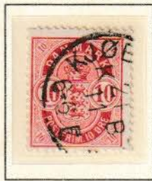
Pos. A 30