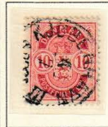
Pos. B 5