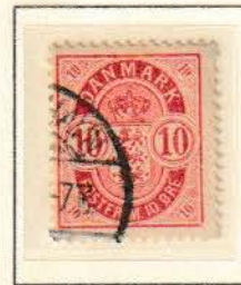
Pos. B 88