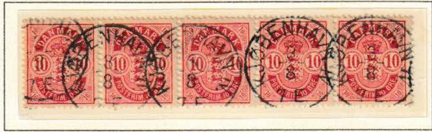
Pos. A 2 - 6