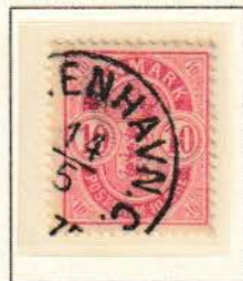
Pos. B 42