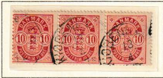
Pos. A 92 – 94