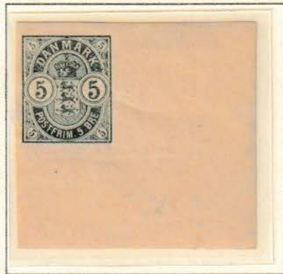
Pos. A 100