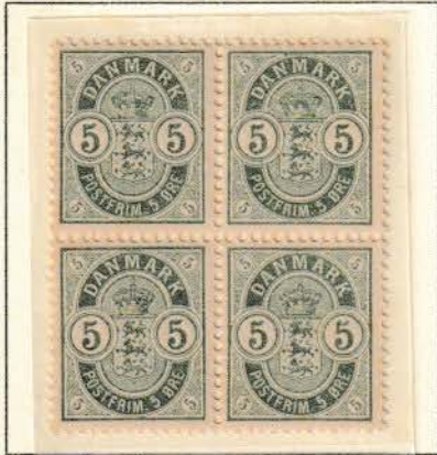
Pos. A 35 – 35/45 - 46