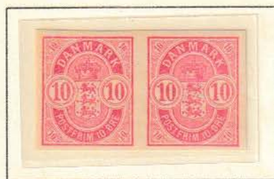
Pos. A 24 - 25