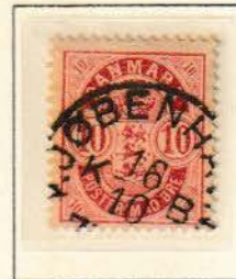
Pos. A 31