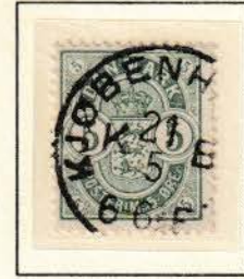
Pos. B 74