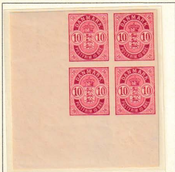
Pos. A 81 -82/ 91 - 92