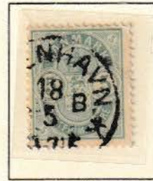
Pos. A 71