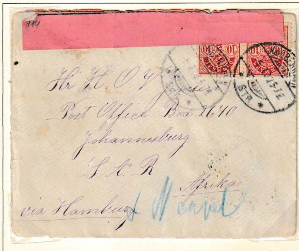
Brev frankeret med 2 stk. 10 øre våbentype tryk 9 i alt 20 øre. UPU takst gældende fra 01.07.1875 til 01.09.1919. Brevet er sendt fra København til Johannesburg Sydafrika 05.07.1900 under Boerkrigen. Brevet er "åbnet under maritim lov" og censureret

2. serie – 10 øre rød 1885 til 1902, tak 14 x 13 ½, Vm II