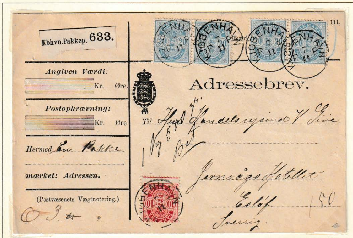
Adressebrev frankeret med 10 våbentype øre tryk 6 med omvendt kamtakning (der er kun registreret 3 mærker med omvendt kamtakning og dette er det eneste våbentype mærke) og 20 øre våbentype tryk 9 pos B 76 – 77 og B 56 - 57 anvendt for pakke sendt fra København 07.11.1889 til Sverige. Takst (1 – 1,5 kg) 90 øre. Indenlandsk takst gældende fra 01.10.1881 til 01.05.1896.