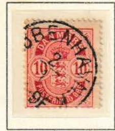
Pos. A. 45