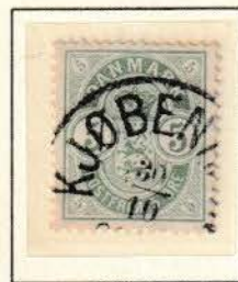
Pos. B 47