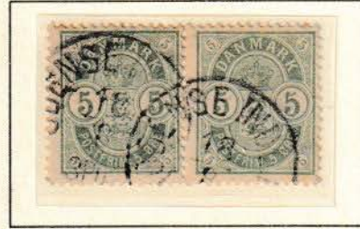
Pos. A 12 - 13