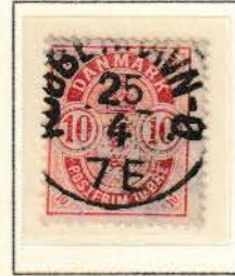
Pos. A 97