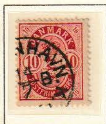
Pos A 42