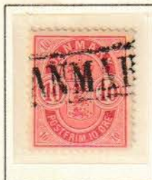
Pos. B 3